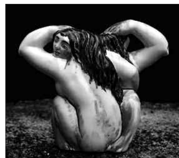
A cara feminina da figura "Xerra-amor", deseñada por Díaz Pardo ca. 1957