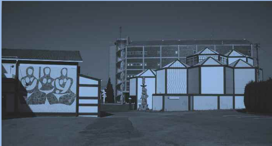
Edifícios do complexo industrial do Castro. Á esquerda a nave de produción, co mural que Luís Seoane deseñou en 19nos anos sesenta; á dereita o Museo Carlos Maside; e ao fondo o Laboratorio de Industria e Comunicación