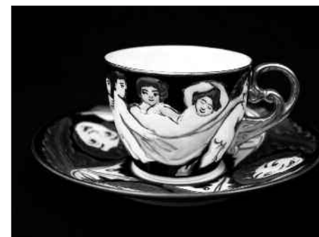
Cunca e prato de café deseñados por Díaz Pardo no Castro, nos primeiros anos cincuenta

A decisión de abandonar a pintura de cabaleta vana tomar Isaac como consecuencia dun suceso que ten lugar en 1947, cando o pintor Álvarez de Sotomayor, daquela director do Museo do Prado, pídelo que participe na decoración mural do santuario de Cuelgamuros, o funesto 'Valle de los Caídos'. Aquelo colma o vaso. Como ía acceder a semellante proposta o fillo dun asasinado polo fascismo! Non o pensa nin un minuto e fuxe a Galicia, onde un ano despois, toma a decisión de adicarse á industria cerámica, farto de pintar o que non lle gusta e para quen non lle gusta. Así pois, a orixe de Cerámicas do Castro está