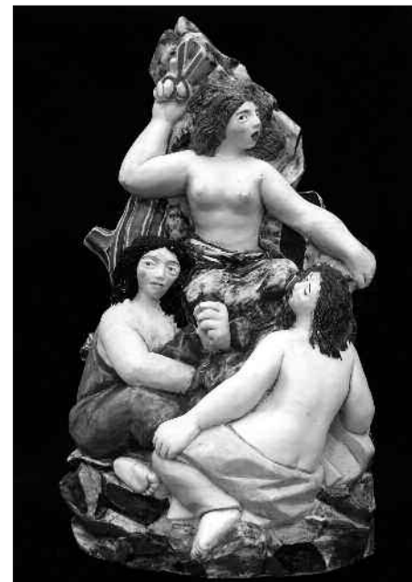
"Costureiras", peza deseñada por Díaz Pardo na primeira etapa do Castro (primeiros anos cincuenta)

nestes dous sucesos madrileños, e relacionado con dous singulares personaxes da plástica española: Sáenz de Tejada e Sotomayor. O primeiro achegouno ao deseño industrial, o segundo actuou de revulsivo para replantexarse a súa carreira e a súa vida.